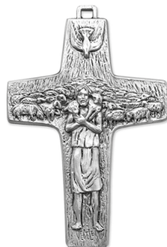
(obr. č. 2)

Kříž vyjadřující poslání Služebníků (obr. č. 1) je jako přímý pohled do Pánova otevřeného Srdce, kde spatříme jeho Rány a intimitu všeho, čím žije: to ale nelze vystavovat zrakům na odiv. Je třeba tento pohled (na bolesti kříže) skrýt jako Krev do kalicha, kde tím kalichem pro vzácnou Krev je kříž papeže Františka (obr. č. 2), který viditelně nosíme i my na znamení toho, že ti, kdo hledají pevnou půdu pod nohama, naleznou ji tam, kde ze skryté (zrakům nepřístupné) bolesti kříže vystupuje navenek živé světlo, radost, síla a neúnavná ochota dobrého pastýře za stádo položit i život. To vše v sobě nese kříž papeže Františka, maják pro ty, kteří hledají záchranu-lásku. Zmateným, poztráceným, hledajícím, zoufajícím, liknajícím, rezignovaným, bloudícím... neukazuje dobrý Ježíš ihned svoji Krev (jejímž znamením je kříž vyjadřující poslání Služebníků), aby neztratili odvahu a neutíkali dříve, než poznají jeho Srdce, ale přitahuje je proměněnou Krví, tedy láskou, něžností a laskavostí svého pružného Srdce (jehož znamením je papežský kříž). Činíme tak i my: služebnický kříž vyjadřující poslání (spolu s naším utrpením, bolestmi, obětmi) nám zůstává obtisknutý diskrétně pouze do stěn srdce, zatímco ten pro všechny viditelný (papežský) nosíme na řetízku v blízkosti srdce. Naše srdce tak uvnitř bije intimně tím, co zrovna prožívá Pán, a navenek z nás vystupuje už